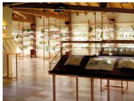
SCHIAVON. Aperitivo al museo

E' gradita la prenotazione per la visita guidata.