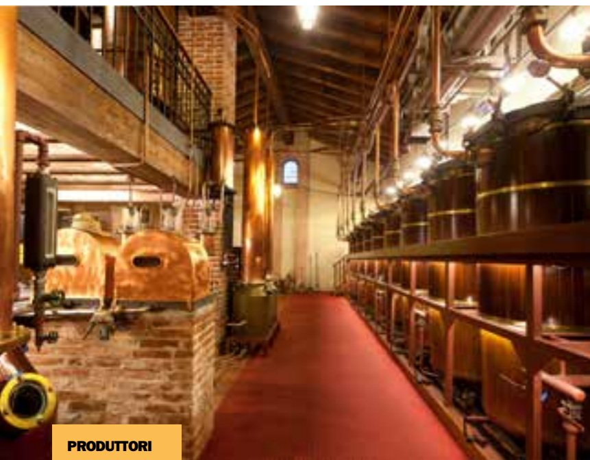
PRODUTTORI DUE IMMAGINI DELL'ALAMBICCO ARTIGIANALE DELLE DISTILLERIE POLI.

che faremo tra dieci anni lo sarà ancora di più. È il contributo della tecnologia».