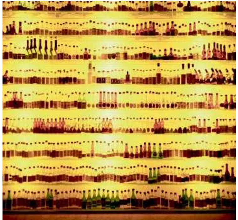
➤ UTSALGET. Grappautsalget til Nardini ligger over det gamle destilleriet på bruene, som måtte flytte da elven steg i 1963. I dag har vannet sunket igjen, og man kan gå ned trappen og snuse inn søtlig produksjonshistorie. I baren er flere typer grappa til salgs. ➤ MUSEET. Grappamuseet til Poli, som ligger cirka 30 meter fra Nardinis bar og utvalg, har en stor samling smågrappaflasker.